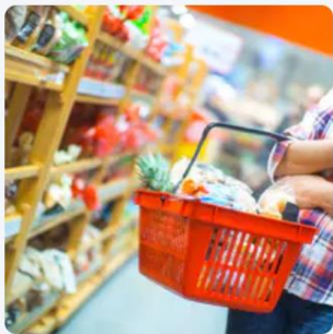
Supérette Haute et basse saison