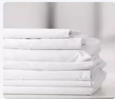
Location de draps Payant