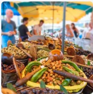
Marché Haute saison