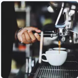
Bar Haute et basse saison