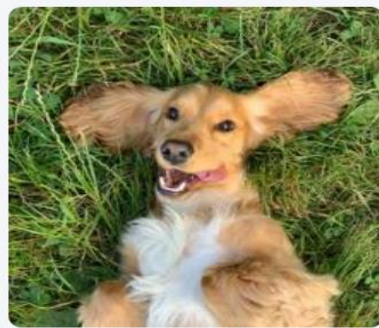
Un chien autorisé (hors 1ère et 2ème cat.) Payant