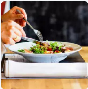
Restaurant Haute et basse saison