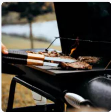
Location barbecue / plancha (selon disponibilité) Payant