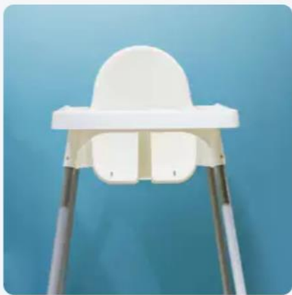
Kit bébé (chaise haute, lit, baignoire...) Inclus