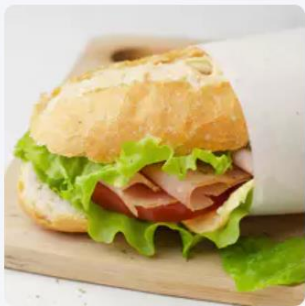
Snack Haute et basse saison